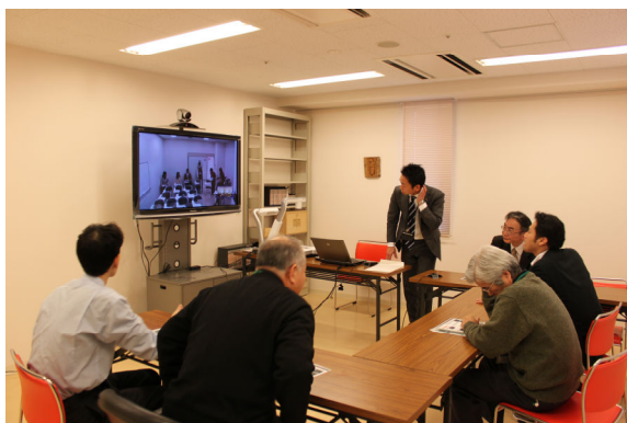
遠隔会議システムの設置