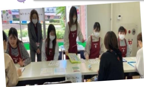
市内大学とのコラボ企画 九州歯科大と一緒に歯と食に関するセミナーを行いました。