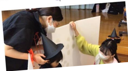
市民センター交流 毎月地域子育てスペースで学生が企画した子どもと親が楽しめる「あそび」を提供しています。