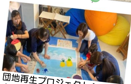
団地再生プロジェクトへの参加 宗像市「ひのさと48」団地で小学生を対象にしたイベントを実施しました。