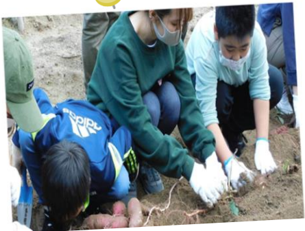
余暇活動支援の取り組み 学内ボランティア団体の学生が主体となり、障害のある子どもやその家族を対象にした活動をおこなっています。