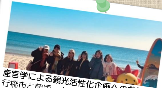
産官学による観光活性化企画への参加 行橋市と韓国・台湾を結ぶ「Sister Beachプロジェクト」に参加しました。