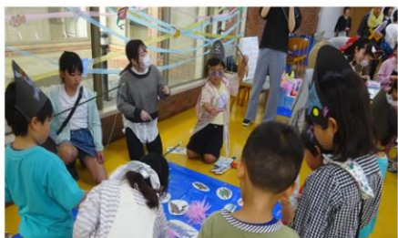
子どもむけイベント 栄養学科・保育科の学生が主体となり、「食」と「遊び」のイベントを実施しました。