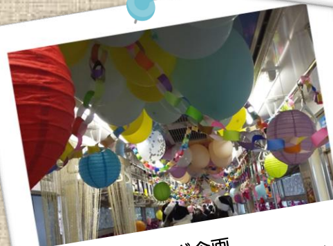
高校生とのコラボ企画 小倉商業高校と一緒に北九州モノレールをデコレーションしました。