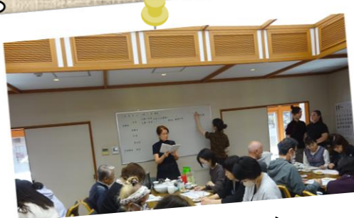
公開講座（中国茶セミナー） 中国茶をとおして市民の方々と異文化を学びました。