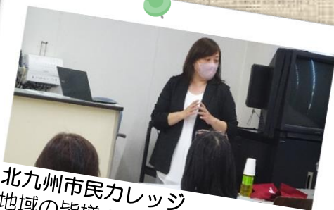
北九州市民カレッジ 地域の皆様の多様な学習ニーズに対応した生涯学習機会を提供しています。